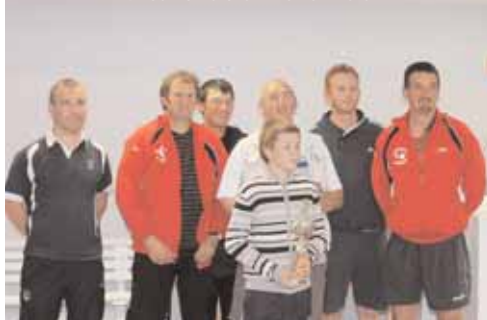
D4 : Saint-Berthevin-la-Tannière 1