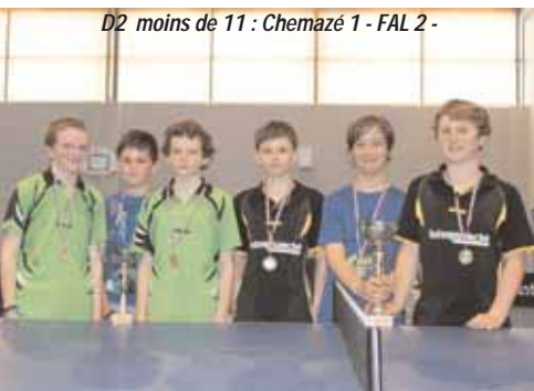
D2 moins de 11 : Chemazé 1 - FAL 2 -