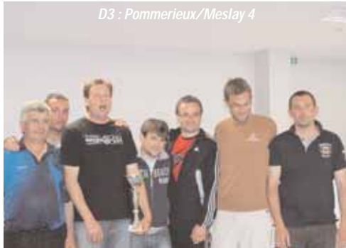
D3 : Pommerieux/Meslay 4