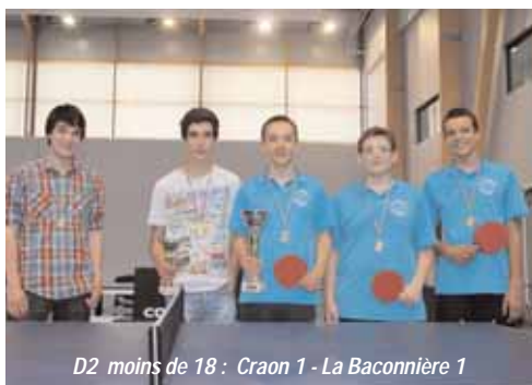
D2 moins de 18 : Craon 1 - La Baconnière 1