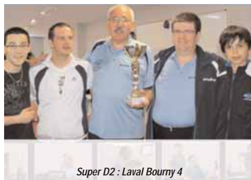
Super D2 : Laval Bourny 4