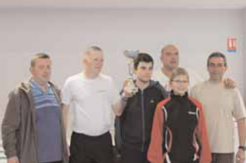
D4 : Louverné 4