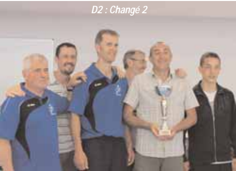
D2 : Changé 2