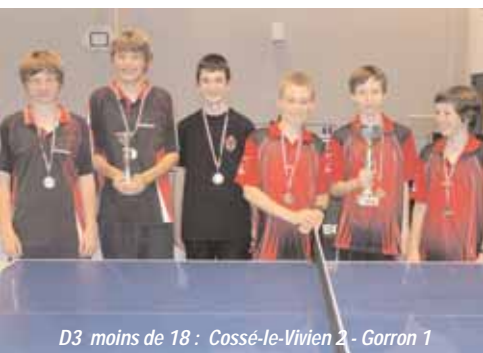
D3 moins de 18 : Cossé-le-Vivien 2 - Gorrion 1