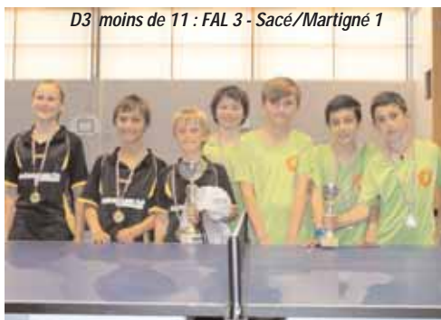
D3 moins de 11 : FAL 3 - Sacé/Martigné 1