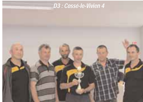
D3 : Cossé-le-Vivien 4