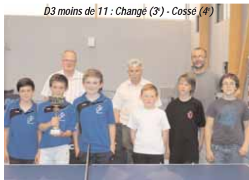
D3 moins de 11 : Changé (3 e ) - Cossé (4 e )