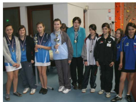
Moins de 13 filles : 1 er Saint-Berthevin/Saint-Loup, 2 e Loiron/Ruillé, 3 e CA Mayenne.