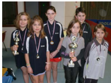
Moins de 11 filles : 1 er Saint-Berthevin/Saint-Loup, 2 e Ernée.