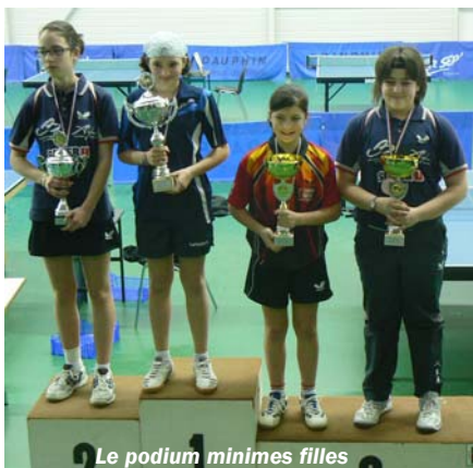
Le podium minimes filles