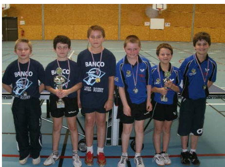
Moins de 11 garçons : 1 er Laval Bourny (1), 2 e CA Mayenne, 3 e FA Laval (1), 4 e Laval Bourny (2).