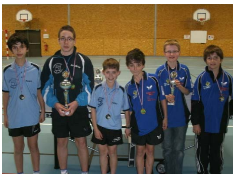
Moins de 13 garçons : 1 er Laval Bourny (1), 2 e CA Mayenne, 3 e Ernée (1), 4 e Changé.