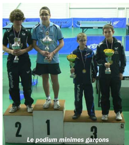
Le podium minimes garçons