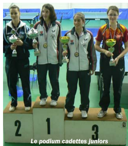
Le podium cadettes juniors